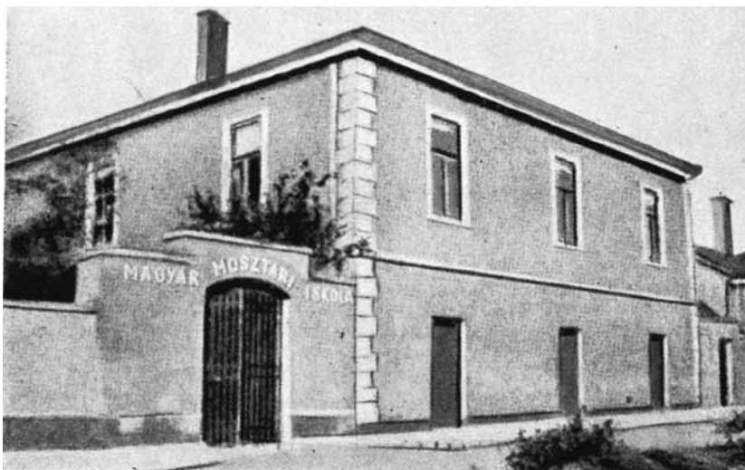
A mosztari magyar iskola Bosznia-Hercegovinában

A közoktatásban – noha a katasztrofális analfabétizmus és iskolátlanság enyhítése elsőrendű román és horvát érdek volt –, a két kormány mégsem az iskolák gyarapítására fordította energiáit, hanem ellen-iskolák és ellen-óvodák felállítására, valamint a magyar pénzen szervezett tanintézetek ellehetetlenítésére. Ezen kívül arra, hogy a tanítás nyelvét, a tankönyvek és tantervek anyagát a többségi nemzet képére és kedvére formálják. 29 Romániában az 1905. szeptember 17-én kelt 51.817. számú kultuszminiszteri rendelettel 21 óvodát létesítettek, ebből hetet a csángóknak, akiknek azonban még anyanyelv-oktatást és magyar hittant sem engedélyeztek. 30 Mintha a román példát másolná, a diakovári megyéspüspök nevét felvett horvátországi Strossmayer Egyesület is az iskola nélküli települések helyett, elsősorban ott kívánt tanodákat szervezni, ahol már magyar vagy német iskola működött. 31