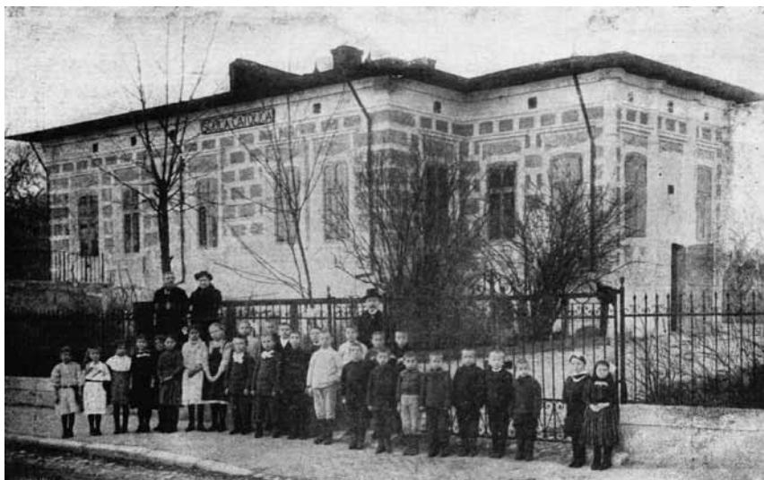
A tárgovisteai magyar iskola a Havasalföldön

kának” számítottak a román munkaerőpiacon. Személyes kiszolgáltatottságuk miatt azonban – mint „hungarák”, illetve „vengerkák” – tömegesen váltak bojárrok, és módos polgárok kitarottjává, vagy emberkereskedők áldozataiként balkáni lebujszongó rongyává. 6