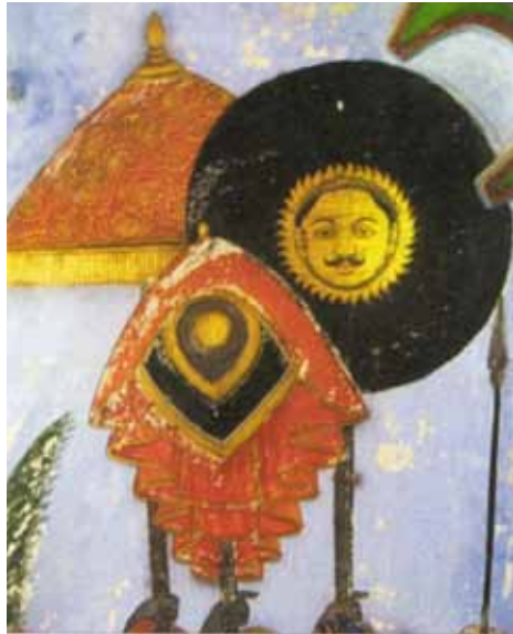
A palotát és díszítését Kru. a 17-ik században építették és készítették.

Nemrég fedezték fel, hogy Udaypurtól délebbre, Dungarpurban van egy már lakatlan, de még jó állapotban lévő elhagyatott volt maharádzsa palota. Annak központi termében a freskók között szintén egy hasonló Napisten ábrázolás látható: