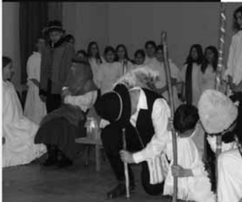
A betlehemes előadásokra már novemberben elkezdődnek a próbák.

Tanítványaink elvitték Fénykrisztus születése örömhírét iskolánk falain túl is: Kecskemét Fő terére, a Városházára, és legnagyobb büszkeségünk, hogy Kárpátalján, Beregszász városában is szólt az ének: „Az angyal énekel...”