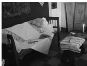
szereénységével, jó tanulásával,

Szent Erzsébet ünnepén kiválasztjuk a legalkalmasabb leánykát, aki méltó lehet Erzsébet gyöngyöt viselni: