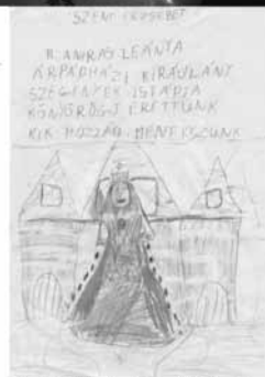
viselkedésével példa a többieknek.

: 7225788-7231 : - 9098-881191-11 : - 01801110-1111191111 : - 1119711-001811-9 : - 024711111-11111111 : : 07102221-11111111-010 : X - ny - 111111 - 081111 :