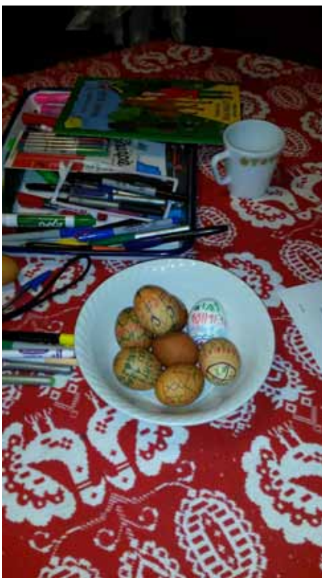
11. kép: Húsvéti ünneplésünk eredményei