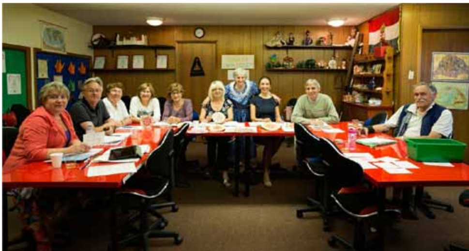
7. kép: Csoportkép az első tanfolyam résztvevőiről