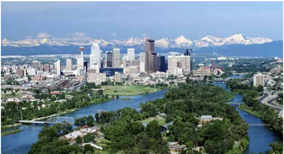
1. kép: Calgary, háttérben a Sziklás-hegység

Calgary Nyugat Kanadában, a Sziklás-hegység lábainál található, több mint 1.2 milliós nagyváros, jelentős magyar illetve magyar származású lakossággal (kb. 18 ezer).