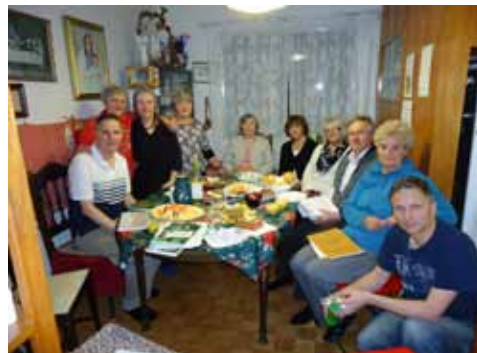
9. kép: Baráti közösségben ünnepelünk