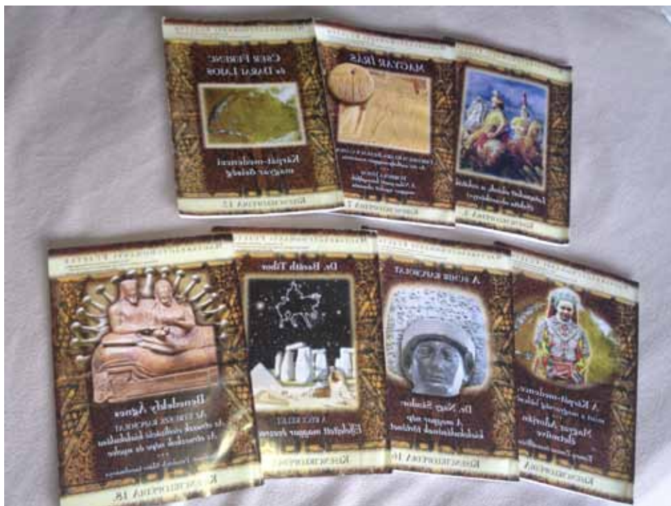
6. kép: Magyarságtudományi Füzetek